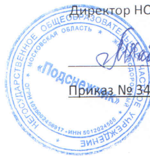
График осуществления контроля качества организации питания в НОЧУ «Подснежник»